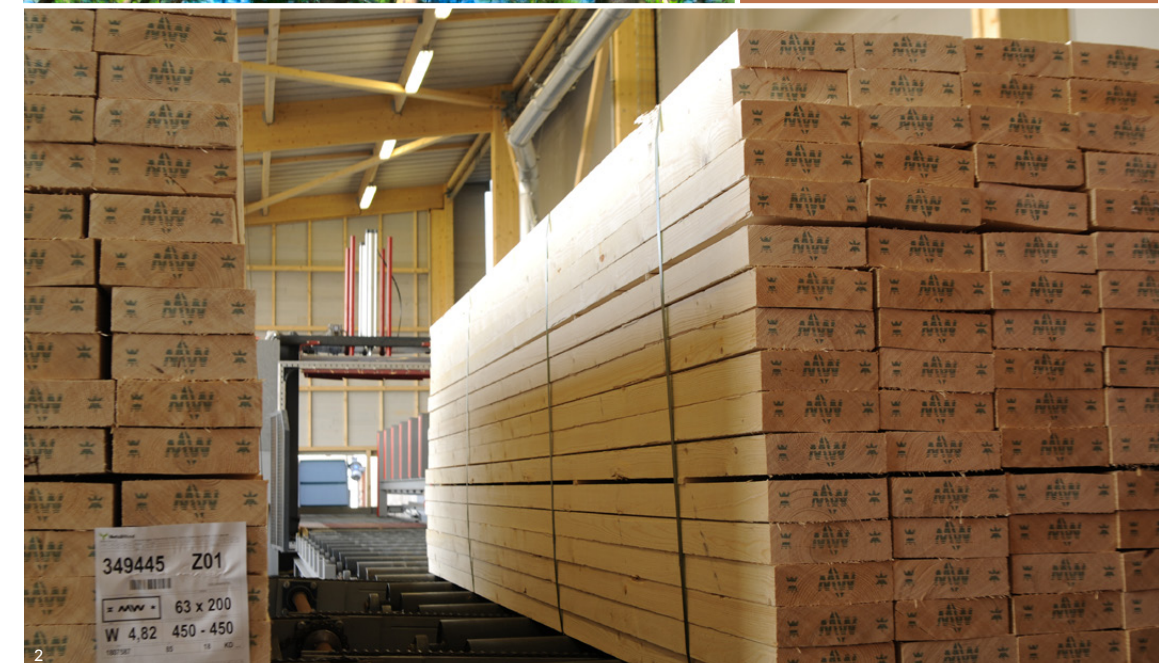
1. Forêt de Pin / 2. Coils de bois sciés

Les qualités dites « US-Non Classé ou Sawfalling » sont les meilleures sélections, que nous recommandons pour les emplois de bois résineux en menuiserie.